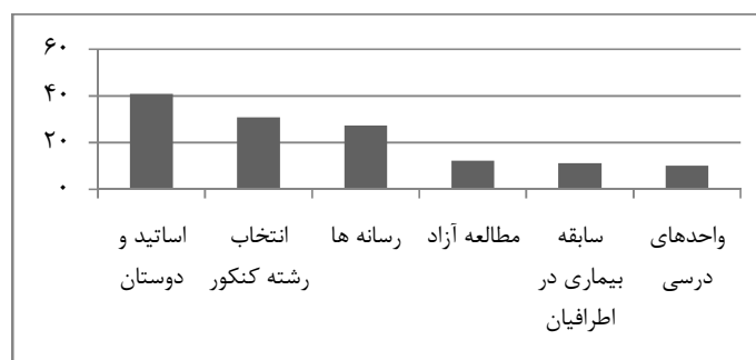
نمودار ۳: توزیع درصد فراوانی منابع کسب آگاهی از علوم توانبخشی

بررسی منابع احتمالی که به نظر می‌رسید در اطلاع رسانی به دانشجویان مورد مطالعه نقش داشته باشد نشان می‌دهد نزدیک به نیمی از افراد مورد مطالعه (۴۰.۹۵ درصد) اظهار نمودند که از طریق «اساتید و دوستان» خود اطلاعات موجود در حیطه علوم توانبخشی