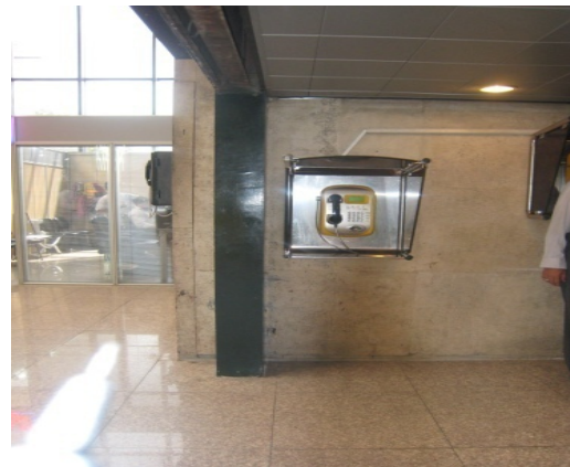
شکل ۱: تلفن عمومی سالن عمومی با ارتفاع مناسب (۴)

در سالن عمومی ترمینال ۲ چهار تلفن عمومی وجود دارد که ارتفاع یکی از آن‌ها کمتر از مابقی است تا برای افراد با صندلی چرخدار قابل استفاده باشد (ضمن اینکه فضای کافی مقابل تمام تلفن‌های عمومی این قسمت وجود دارد و افراد با صندلی چرخدار به راحتی می‌توانند به آن‌ها دسترسی داشته باشند). طراحی کیوسک روزنامه فروشی خودکار- با توجه به محل وارد کردن پول و دریافت روزنامه- نیز برای استفاده با صندلی چرخدار مناسب است.