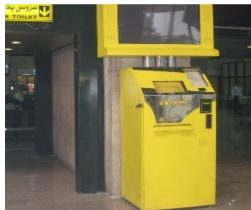
شکل ۲: روزنامه فروشی خودکار سالن عمومی با ارتفاع نامناسب (۴)