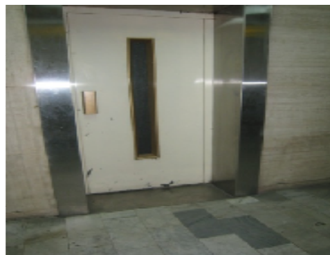
شکل ۴: آسانسور سالن عمومی با ابعاد نامناسب (۴)