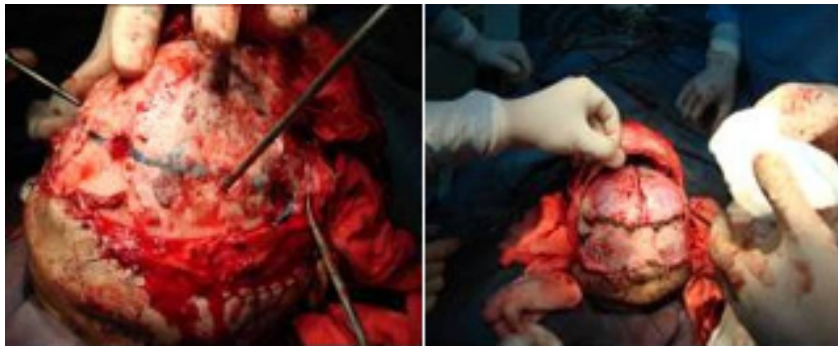
شکل (۲): ایجاد حفره بر روی جمجمه و برش عرضی آن.

پلیت با جنس استیل صورت می‌پذیرد. در شکل (۳)، نحوه قرارگرفتن پل‌های استخوانی و پلیت‌ها بر روی جمجمه نشان داده شده‌است.