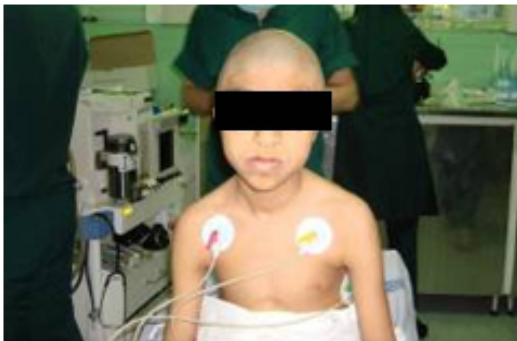
شکل (۱): تغییر فرم جمجمه بیمار و ایجاد فشار در حفره چشمی.

در این مقاله، یکی از جراحی‌های کرانیوپلاستی انجام شده در داخل کشور مورد بررسی و تحلیل قرار گرفته است. بیمار که در شکل (۱) نشان داده شده است، مبتلا به کرانیوسین استوزیس کروئال می‌باشد. بر اثر این بیماری، تغییر فرم در جمجمه بیمار ایجاد شده که به دلیل وجود فشار در حفره چشمی، متعاقباً بنیایی بیمار کاهش یافته است.