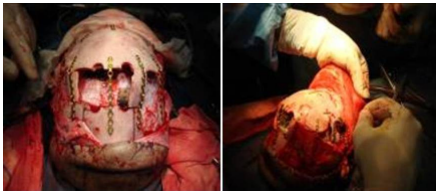
شکل (۳): ایجاد پل استخوانی و اتصال پلیت بر روی آن.

برای ایجاد یک فضای مناسب جهت قرارگیری جمجمه و کاهش فشار وارد بر چشم‌ها، دو پل استخوانی از جمجمه بریده می‌شود و بین دو قسمت قدامی و خلفی جمجمه قرار می‌گیرد. در پایان، اتصال قطعات جمجمه از طریق