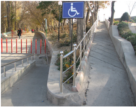
تصویر ۱۲: مناسب‌سازی پارک ائل گلی تبریز برای جانبازان و معلولین