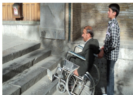
تصویر ۶: وجود اختلاف سطح در مسیر پیاده‌راه و تعبیه‌نشدن رامپ در کنار آن