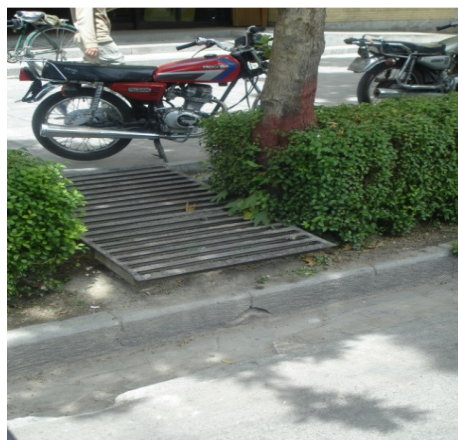
تصویر ۵: قطع پیوستگی پل ارتباطی با خیابان