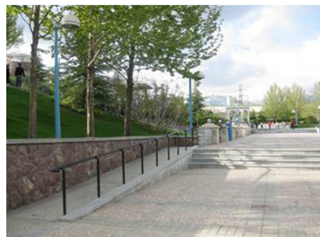
تصویر ۱۱: پارک گفتگو نمونه‌ای از طراحی مناسب برای استفاده معلولین