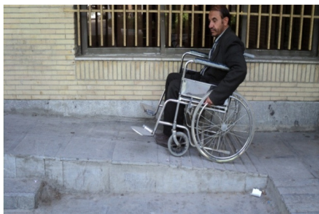
تصویر ۸: نصب‌نشدن دستگیره در طرفین رامپ