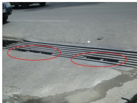
تصویر ۴: نمونه‌ای از یک پل ارتباطی ناهموار نامناسب برای عبور معلولین