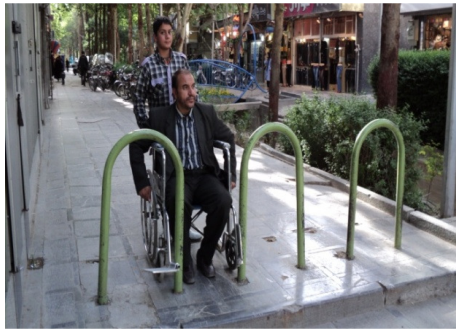
تصویر ۷: وجود موانع در ابتدای برخی ورودی‌ها