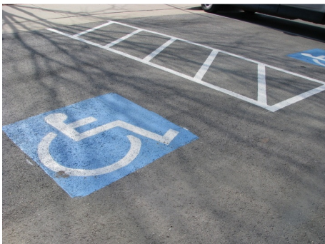
تصویر ۱۳: تعبیه پارکینگ مناسب برای استفاده جانبازان و معلولین (منبع: ۲۱)