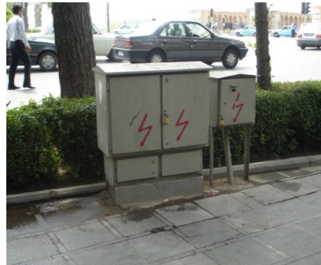
تصویر ۳: استقرار غلط مبلمان در معابر