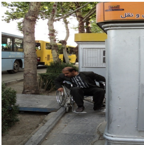
تصویر ۹: غیرهمسطح بودن پل با پیاده‌رو و وجود مانع در مسیر حرکت