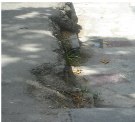
تصویر ۲: تعبیه‌نشدن جدول بین پیاده‌رو و جوی کنار آن

• وجود ناهمواری‌ها و شکستگی مصالح در کف معابر.