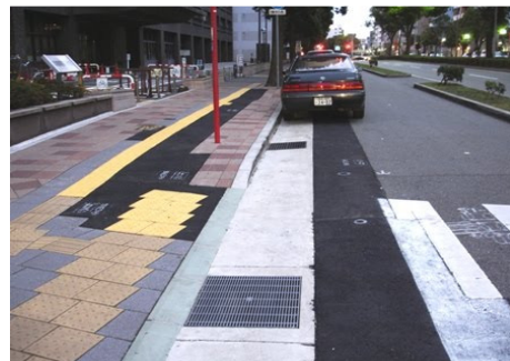
تصویر ۱۰: حذف لبه جدول در محل ورودی پیاده‌رو جهت عبور ویلچر (منبع: ۱۹)