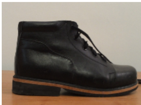
شکل ۱: نمونه کفش طبی با پاشنه استاندارد