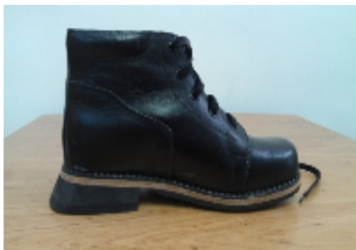
شکل ۲: نمونه کفش طبی با پاشنه دارای لبه خلفی مثبت

دستگاه مورد استفاده برای جمع‌آوری داده‌های نیروی عکس‌العمل زمین، دستگاه صفحه نیروسنج کیستلر (Kistler force plate) مدل ۹۲۸۶A واقع در آزمایشگاه ارگونومی دانشگاه علوم بهزیستی و توانبخشی بود (شکل ۳).